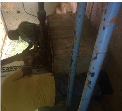
Equipo de Quebrada Honda