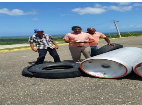
Inventario Productos Químicos