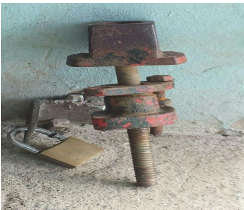
Eq. De operación y Mantenimiento