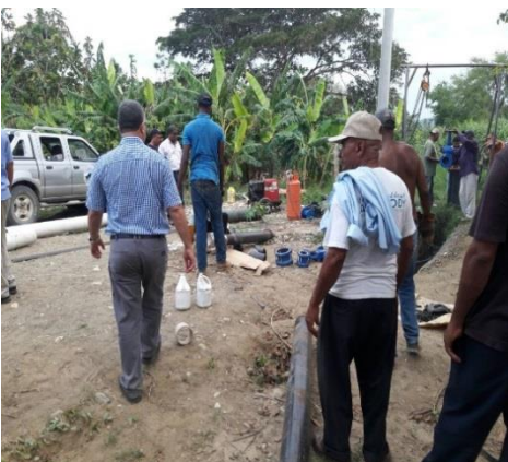
En Palo Blanco