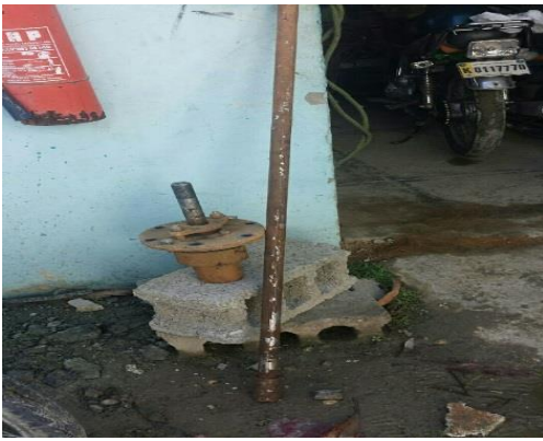
Eq. De operación y Mantenimiento