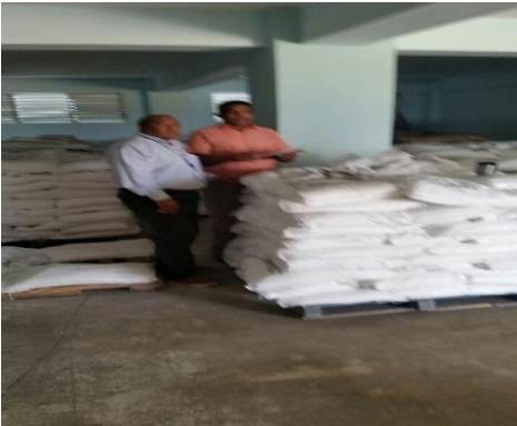
Inventario Productos Químicos

Algunas evidencias de los trabajos reportados al departamento mes de septiembre: