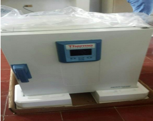
Equipos del Laboratorio Adquiridos mediante orden06/2017 de la Unidad de