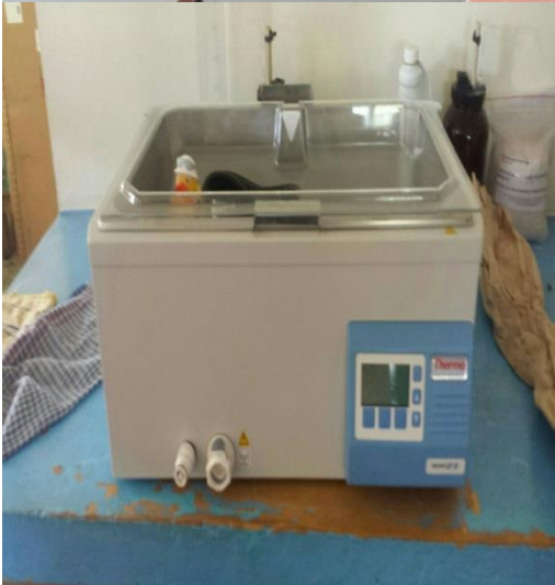
Equipos del Laboratorio