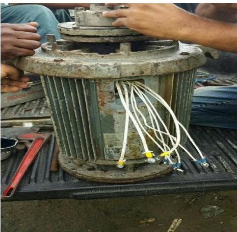
Motor perteneciente a los Pilonos